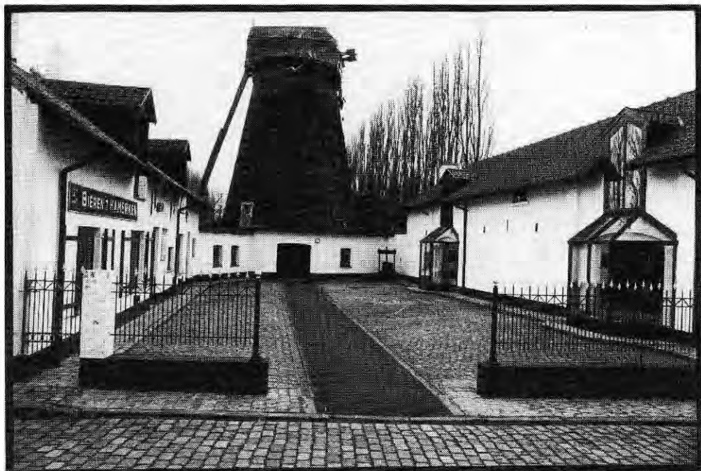
Tabaksmuseum De Brikkenmolen

De streek rond Wervik leent zich uitstekend voor een bezoek van de tabaksliefhebber. Het nieuwe Tabaksmuseum " De Brikkenmolen"opende 4 april j.l. haar deuren.Het museum, gelegen aan de Koestraat te Wervik is geopend van 14.00 tot 18.00 uur. Geëxposeerd worden allerlei voorwerpen over pijpen en tabak. In Harelbeke vinden wij het Stedelijk Museum voor Pijp en Tabak aan de Marktstraat 100. Ook hier een museum met een collectie van de tabak in het algemeen. De Openingstijden zijn elke eerste en derde zaterdag van de maand van 14.00 tot 17.00 uur. Het Museum voor oudheidkunde te Kortrijk aan de Broelkaai 6, herbergt een unieke ceramiekcollectie. In de aanwezige pijpenkamer is de collectie van de Pijpenfabriek Debevere te bezichtigen.Het museum is geopend van 10.00-12.00 uur en van 14.00 tot 17.00 uur, maar niet op zondag.