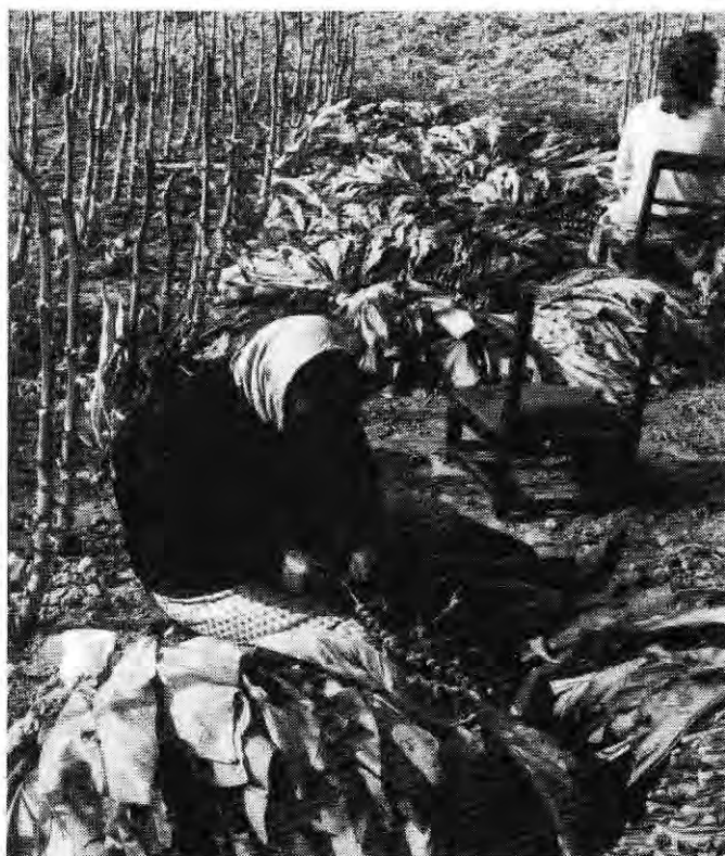
tabaksnaaister op het veld. Wervik, septem- ber 1985.

goed bemest zijn. Na enige tijd wordt de kop uit de plant genomen en voorkomen wordt dat er zijscheuten ontstaan. Vanaf half juli is de plant oogstrijp. De oogst gebeurt blad voor blad of in zijn geheel. Dan rijgt men op het veld de bladeren aan een lange draad (tabaksnaaien). Voor de tabakspuk en het naaien doet men vaak een beroep op tijdelijke arbeidskrachten. Het drogen gebeurt op het veld, onder plastic om de regen te weren. De bladeren hangen in dichte rijen naast elkaar. Zijn ze droog, dan worden ze nagedroogd in de ast, de droogzolder. De arbeidsintensieve tabaksteelt wordt vooral bedreven door familiebedrijven. Drie kwart van die bedrijven heeft minder dan 7,5 ha. Om de bedrijven renderend te houden zoekt men oplossingen in de mechanisatie.